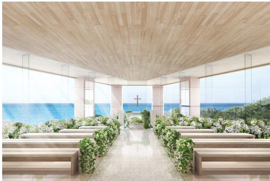
チャペル内装イメージ